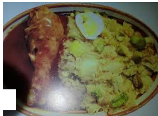
Sopa con mole