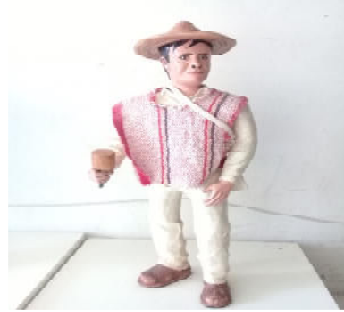
Danza de los Moros