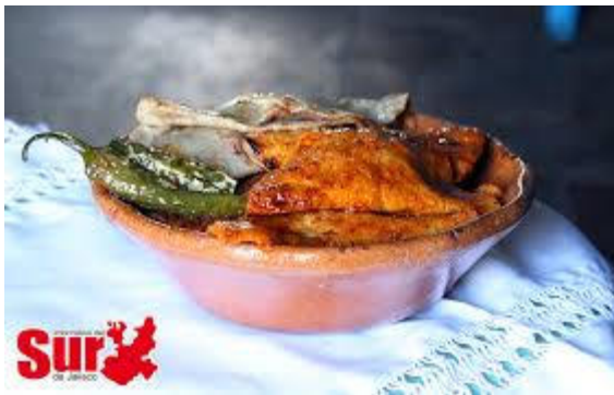
Tacos de la estación