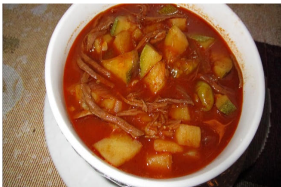
Picadillo de combate