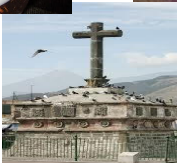
o 3, Imágenes culturales.