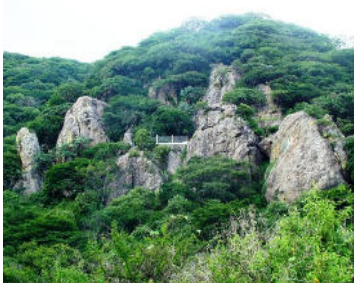
Anexo 3, Imágenes Naturaleza