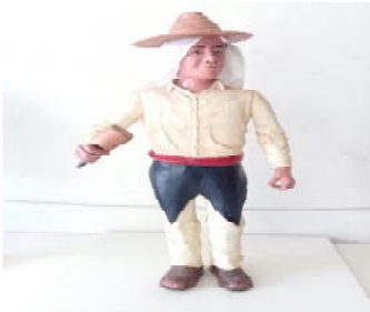
Danza de Negritos