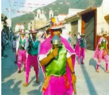
Danza de los Malinchitos