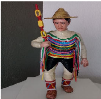
Danza de Sonajeros Chayacates